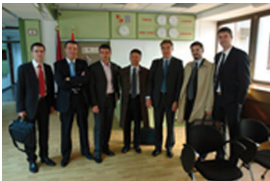
Die Delegation der EFFAS in der Serbischen Nationalbank

Die ÖVFA wird auch in Zukunft die besondere Beziehung unseres Landes und unserer Gesellschaft zu den Ländern dieses Raums nützen, um Initiativen dieser Art voranzutreiben.