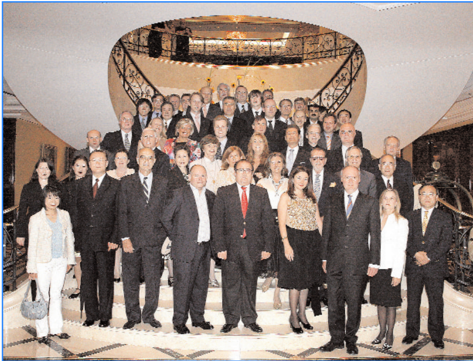
Annual General Meeting of ACIIA and EFFAS joint dinner, Berlin, June 2007

lysts (ACIIA) die Ausbildung zum Certified International Investment Analyst (CIIA®) anbietet. In den letzten Jahren haben 51 österreichische Kolleginnen und Kollegen dieses Diplom erworben (weitere 58 stehen derzeit in Ausbildung). Sitz der EFFAS ist Frankfurt. Die beiden Exekutivorgane der EFFAS sind das General Meeting, in dem die nationalen Mitgliedsgesellschaften vertreten sind, und das Executive Management Committee (EMC). Präsident des EMC ist Herr